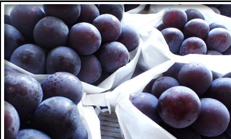
巨峰・ピオーネ 他 山梨 他