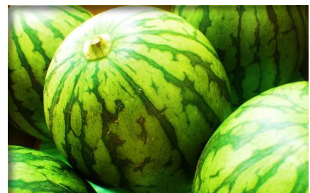
すいか (大玉・小玉) 各地