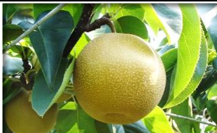
梨 千葉 他