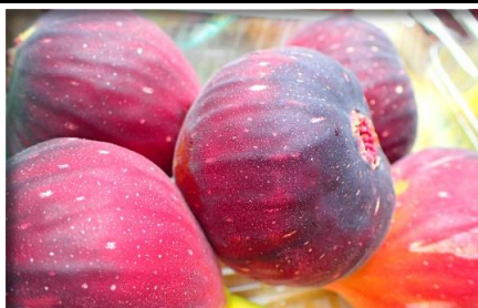
いちじく 愛知 他