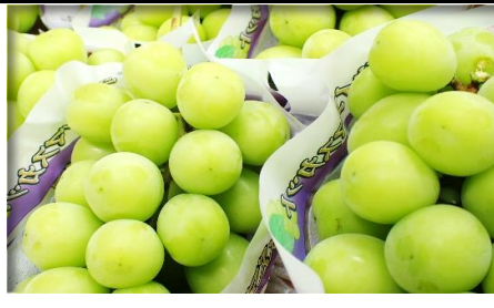
シャインマスカット/アレキサンドリア 他 山梨/岡山 他