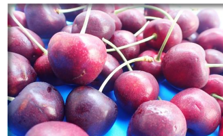
アメリカンチェリー アメリカ