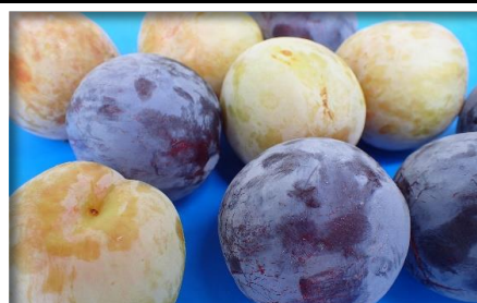
プラム各種 山梨 他