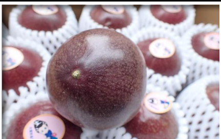
パッションフルーツ 鹿児島 他