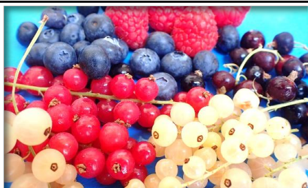
ベリー類 アメリカ 他