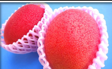
マンゴー各種 国産・輸入