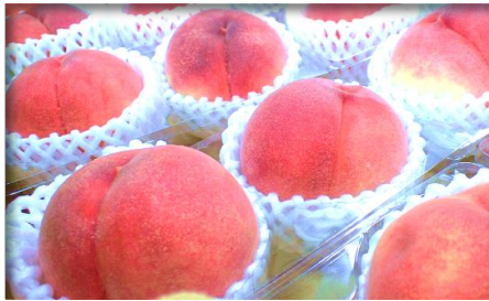
もも 山梨 他