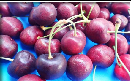
アメリカンチェリー USA