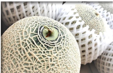
メロン各種 静岡他