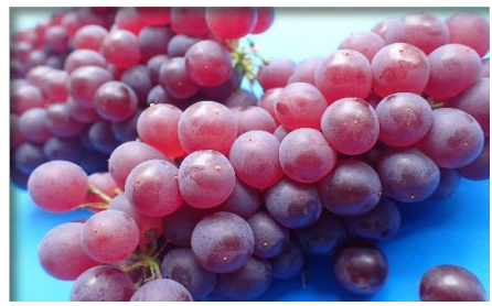
デラウェア 山梨他