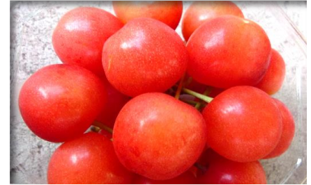
さくらんぼ 山形他