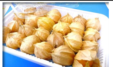
食用ほおずき 愛知