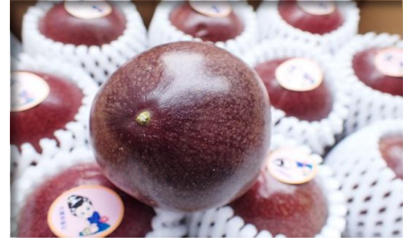
パッションフルーツ 沖縄