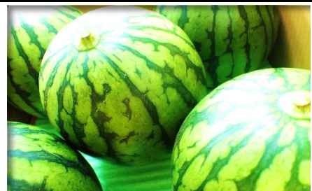
すいか 群馬、熊本他 (小玉・大玉)