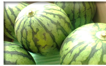
すいか 熊本 他 (小玉・大玉)