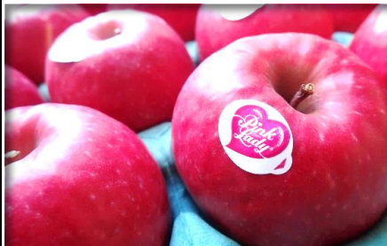
りんご各種 青森・長野 他