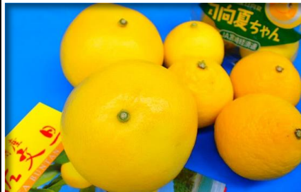
文旦・日向夏 高知・宮崎