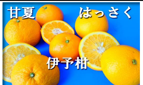
甘夏・伊予柑・八朔 愛媛・広島 他