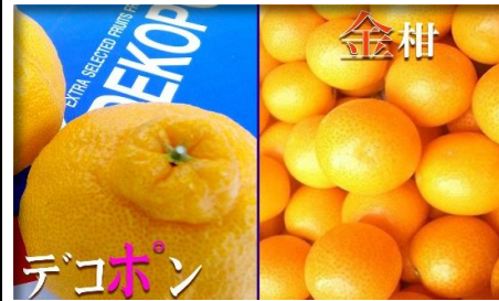
デコポン・金柑 熊本・宮崎 他