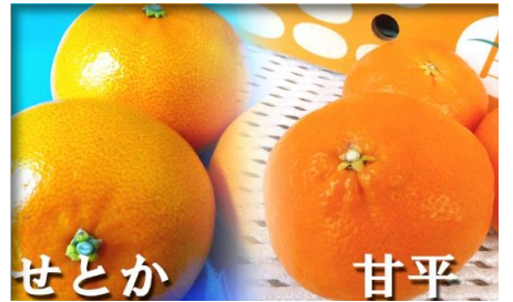
せとか 甘平 愛媛 他