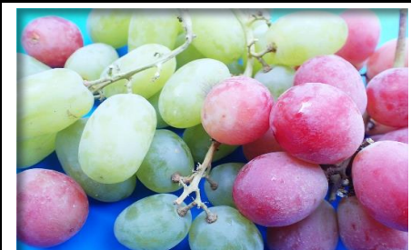
輸入ぶどう類 チリ 他