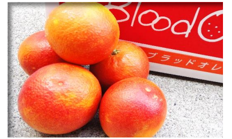
ブラッドオレンジ 愛媛 他