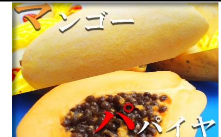
マンゴー・パパイヤ 愛媛